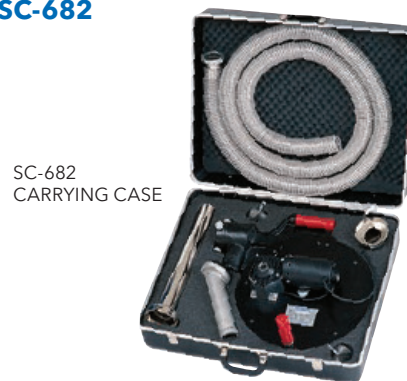
SC-682 CARRYING CASE

NOTE: CONTACT FACTORY IF LONGER STRAIGHT OR OFFSET BAYONET NOZZLES ARE NEEDED FOR YOUR APPLICATION.